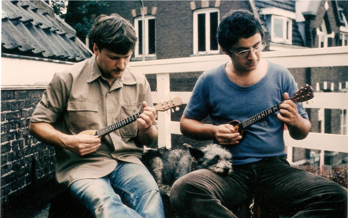
Δύο μπαγλαμάδες και ένα σκυλί...

In de jaren daarna volgden ontelbare optredens in restaurants, feest- en concertzalen, tot en met het Hilton toe. Paradiso, Muziekcentrum Vredenburg en de Melkweg, maar ook laagdrempelige parkspektakels en klapstoeltjesconcerten.