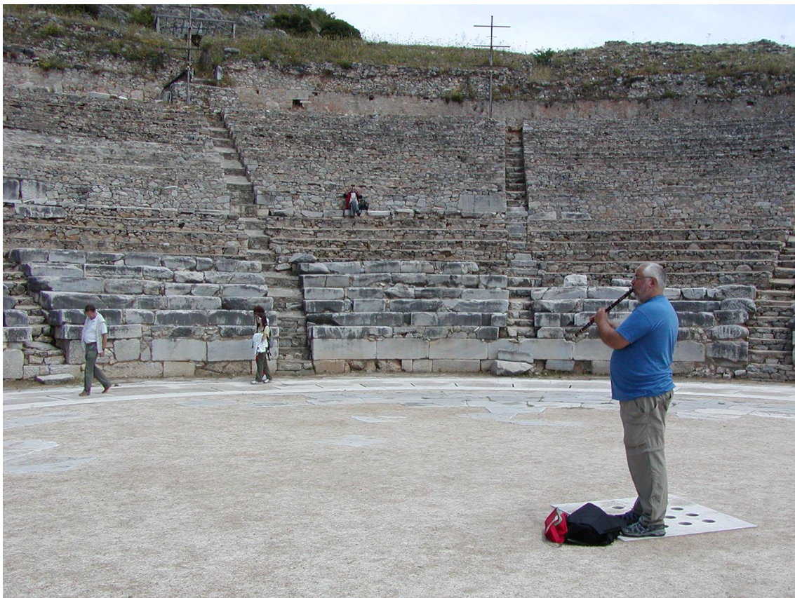
De maestro ten voeten uit: ney spelend in het amfitheater van Filippi (bij Kavála)