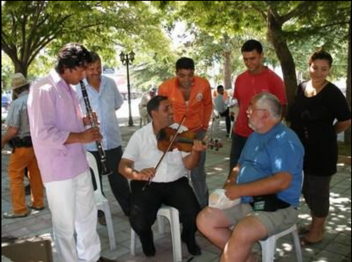
Ipsala, Turkije : Kijk, vioolspelen dat doen wij zo!