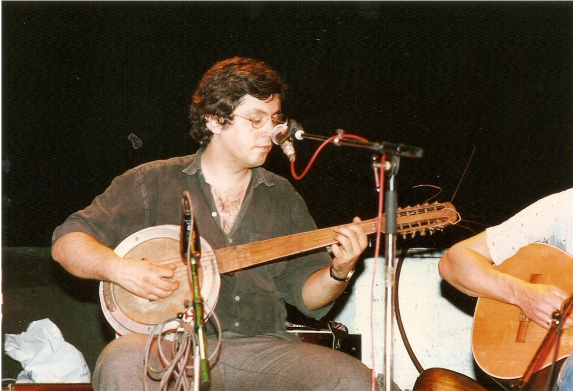
Takis cümbüş spelend